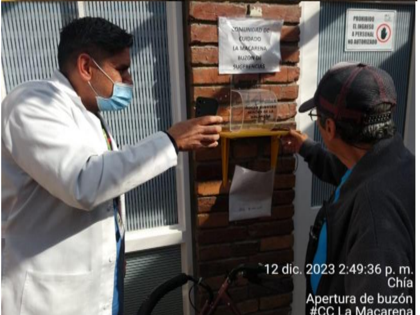
12 dic. 2023 2:49:36 p. m. Chía Apertura de buzón #CC La Macarena