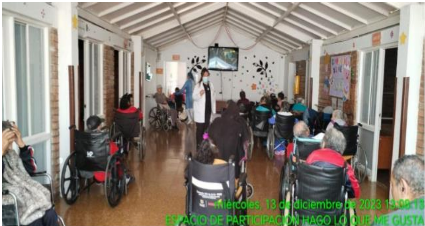
miércoles, 13 de diciembre de 2023 13:08:18 ESPACIO DE PARTICIPACION HAGO LO QUE ME GUSTA