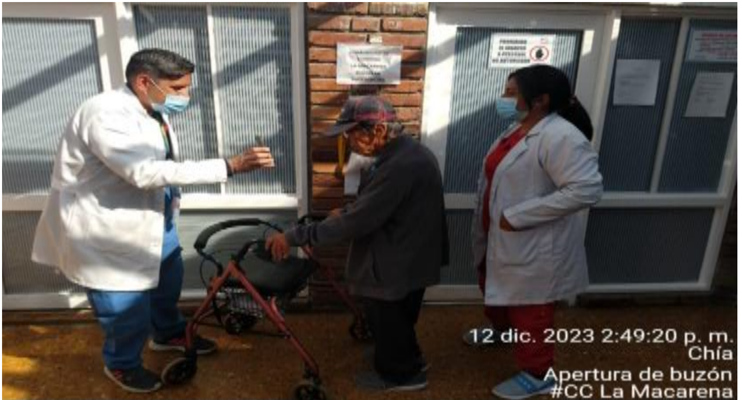
12 dic. 2023 2:49:20 p. m. Chía Apertura de buzón #CC La Macarena