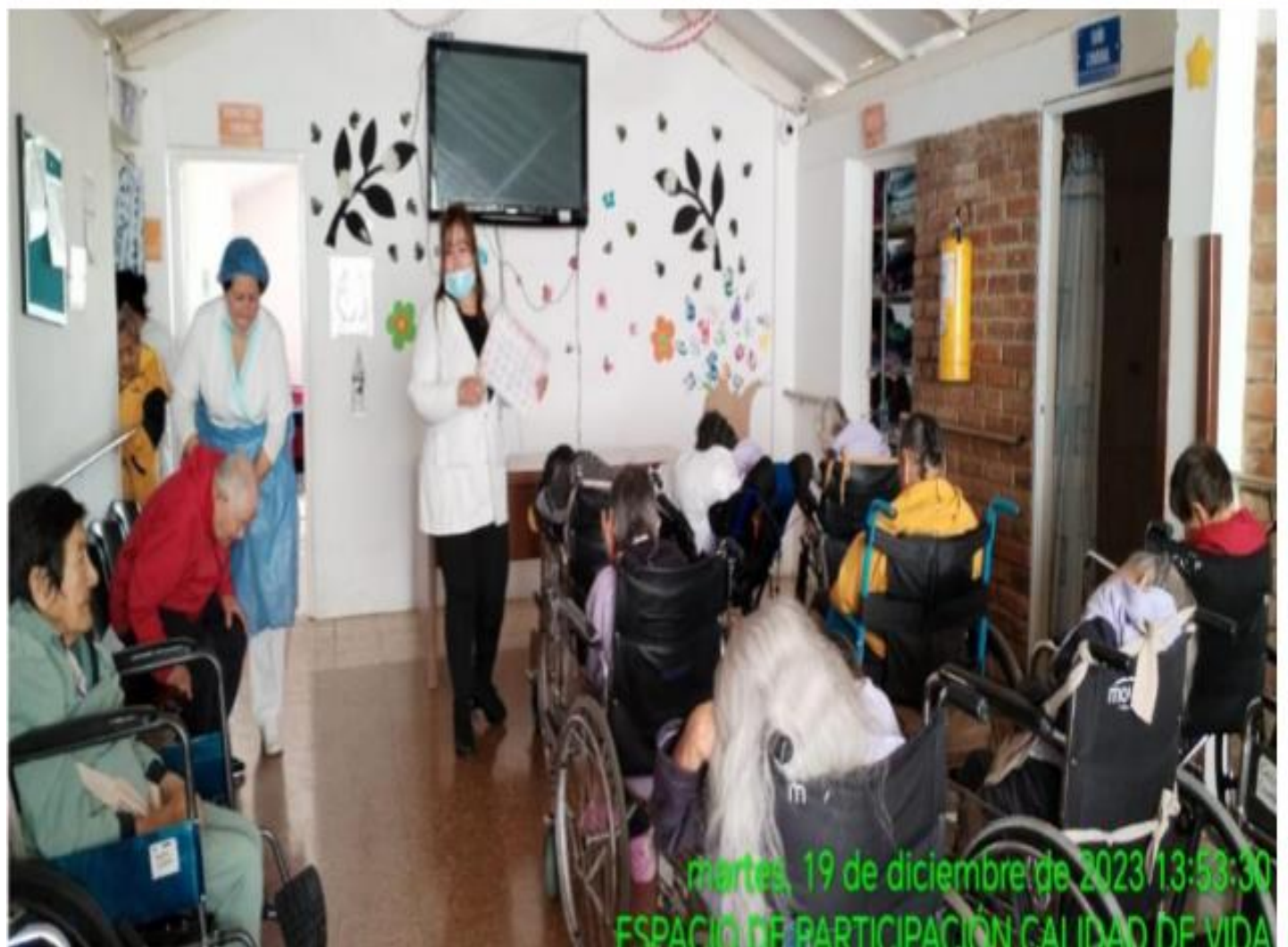
martes, 19 de diciembre de 2023 13:53:30 ESPACIO DE PARTICIPACION CALIDAD DE VIDA